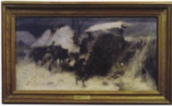
Józef Brandt Konfederaci barscy 1875 r.