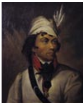
wg Józefa Grassiego

Portret Kościuszki w wieku chłopięcym ok. 1761 r.