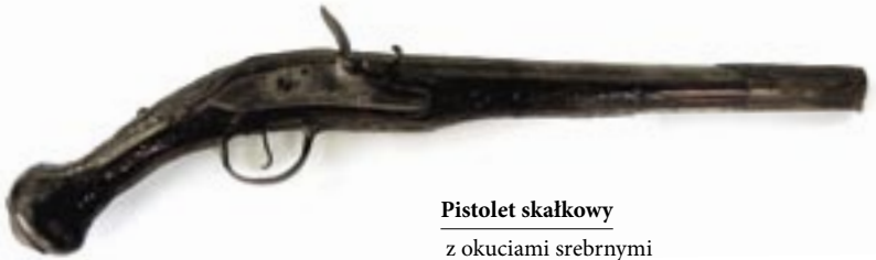
Pistolet skalkowy z okuciami srebrnymi cyzelowanymi XVIII w.