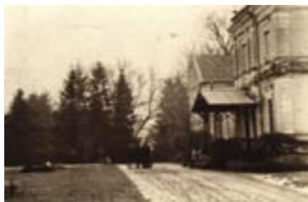
Dwór w Winiarach fotografia archiwalna lata 20-te XX w.