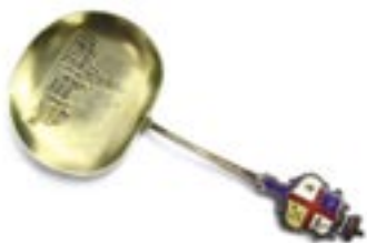
Łyżeczka pamiątkowa, Town Hall Sydney XIX w.